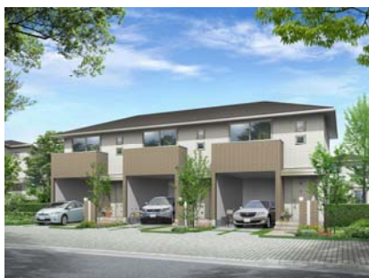
《本件に関するお問い合わせ》