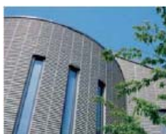
アールドウォール