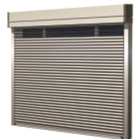
日射制御エアリーガード

自動で日射を制御する電動防犯ブラインドシャッター「日射制御エアリーガード」（トヨタ自動車株式会社・アイシン精機株式会社と共同開発）を新たに設定した。