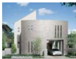
カーブドウォール