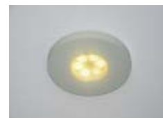
丸平型ダウンライト

トヨタグループ企業である豊田合成株式会社製のLED照明を新たに追加した。洋室用LEDのダウンライト2種（小型、丸平型）。省エネ性能に優れたLED照明のバリエーションを拡大することで、環境にやさしい家づくりを一層推進していく。価格（税込）は小型14,700円、丸平型13,650円。