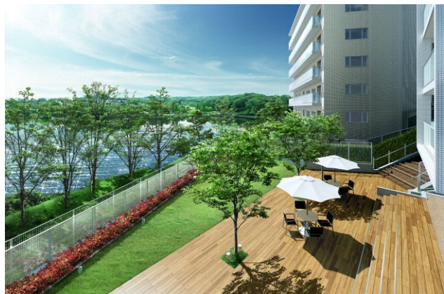
イメージ図：(左) ゲストルーム、(上) ラグナテラス