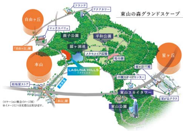
イメージ図：(左) 全体鳥瞰図、(上) 周辺地図