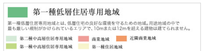
▲東中野三丁目周辺用途地域概念図