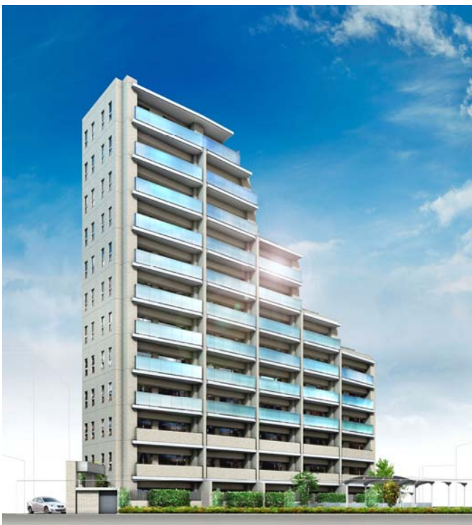
▲建物外観完成予想図