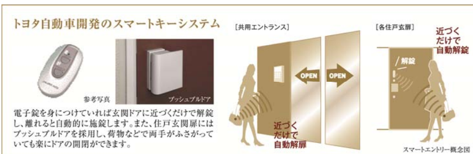
▲スマートキーシステム概念図

スマートキーはトヨタ自動車株式会社の登録商標です。また、防犯モード・共用エントランス用スマートキーシステムはトヨタ自動車株式会社、株式会社東海理化、美和ロック株式会社との共同開発品です。