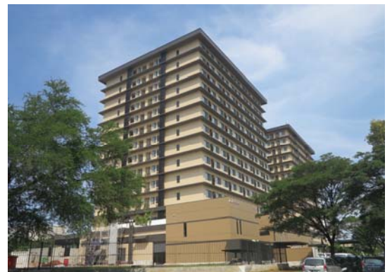
アクシア・サウスチカラン第2期客室棟外観(手前)

アクシア・サウスチカランは、お客さまの声や経験・ノウハウを生かし、さらなる利便性と日本品質のおもてなしを追求します。