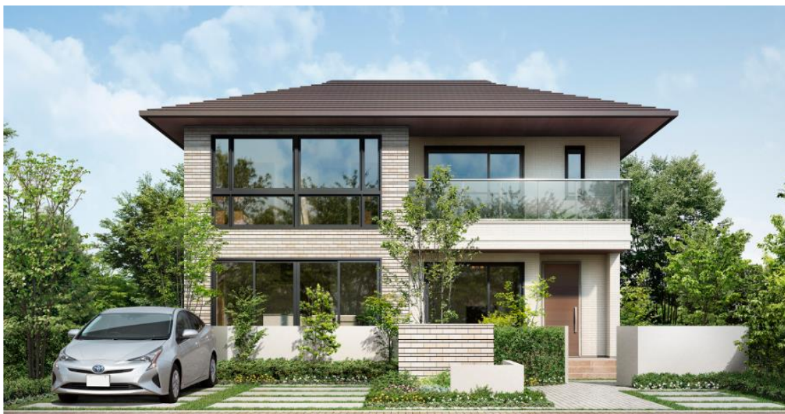
＜「40周年記念 Thanks モデル」代表プランの外観＞

今回の記念モデルは長年ご愛顧いただいていた感謝の気持ちを込めて、2018年3月までのご注文に限り、ユニット工法「シンセ」シリーズの延べ床面積110㎡以下のプランを対象に、大空間・大開口などトヨタホームらしさを訴求しつつ、お求めやすい価格設定で提供させていただきます。