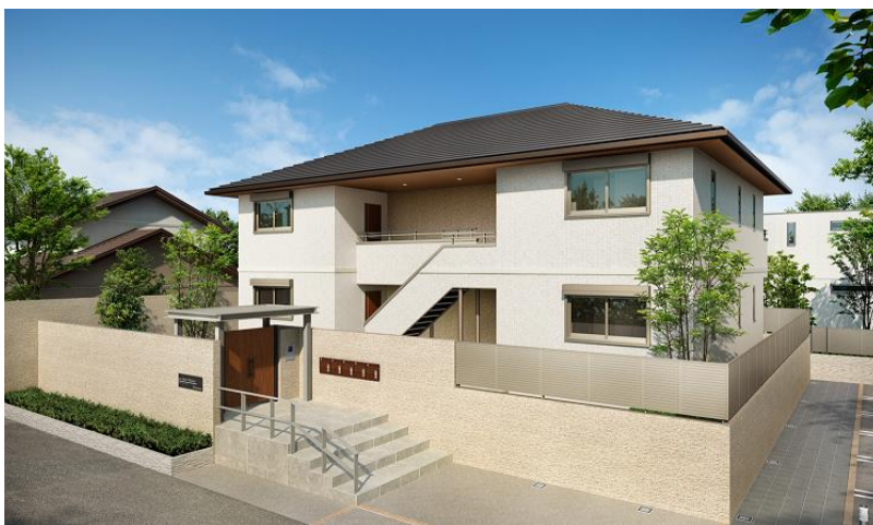
＜ 大きな勾配屋根で邸宅感を演出 シンセ・スマートメゾン ＞