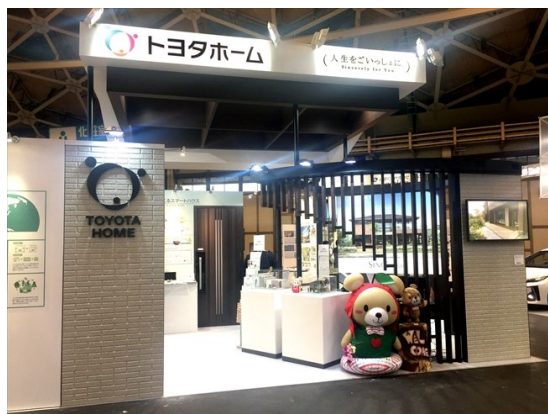
<昨年の出展ブース>