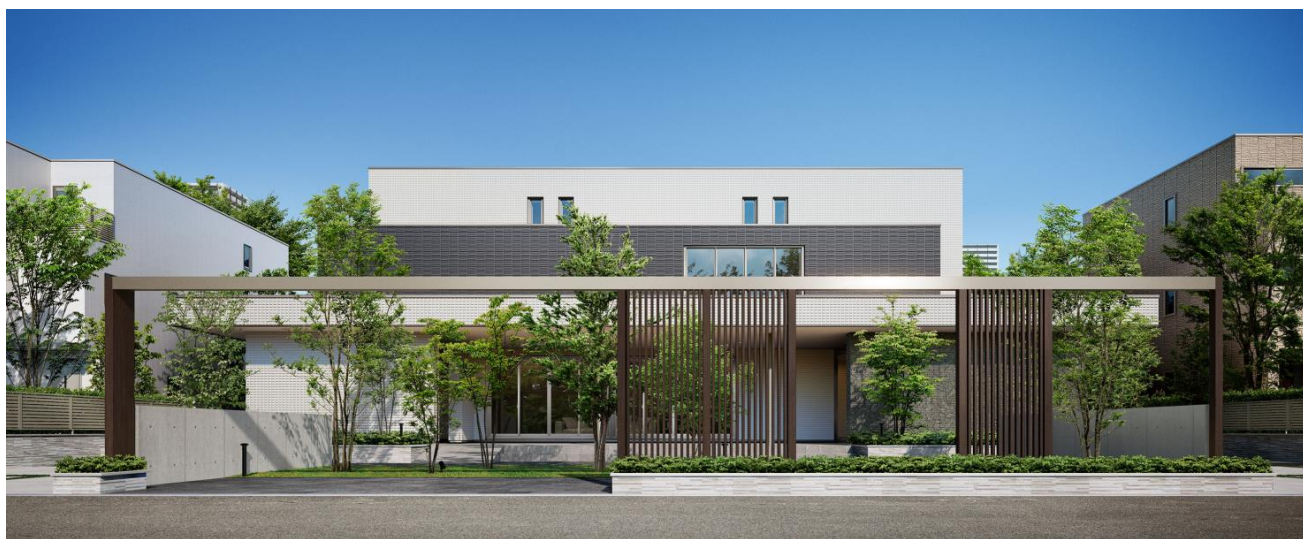
「ESPACiO URBAN MAISON（エスパシオ・アーバンメゾン）」

外観は厚さ100mmの軽量気泡コンクリート（ALC）外壁を用いた重厚感のあるデザインとし、エントランスはマンションのような上質感のある空間に仕上げました。共用エリアには、ゆったりとくつろげるコミュニティスペースを設け、居室エリアには戸建と同グレードの充実した設備を取り入れました。また耐火構造を採用し、都市部におけるオーナー様の土地活用ニーズに対応します。