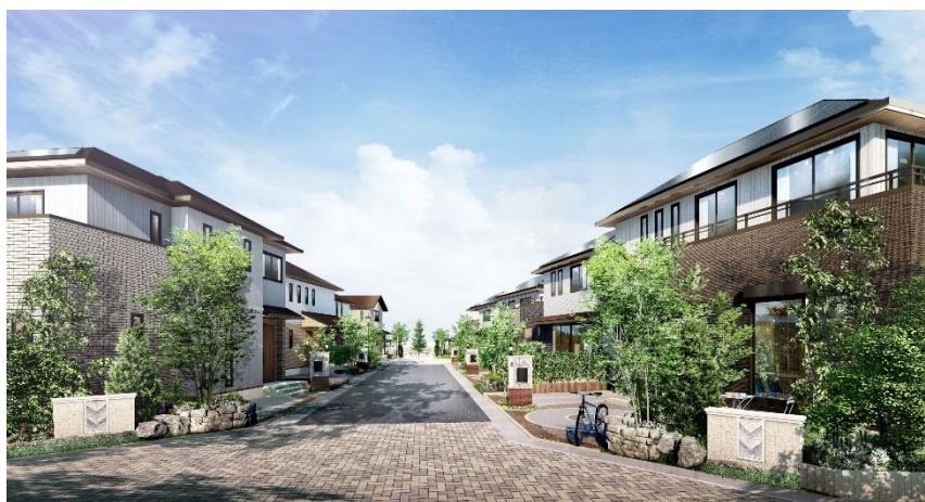
分譲地（電線地中化した街並み）

当案件は北総線・成田スカイアクセス線「印西牧の原」駅まで徒歩 11 分。大型ショッピングモールをはじめ、さまざまな商業施設や自然豊かな公園が充実したエリアに、トヨタホームのアイデアとこだわりを具現化した新たな街が誕生します。