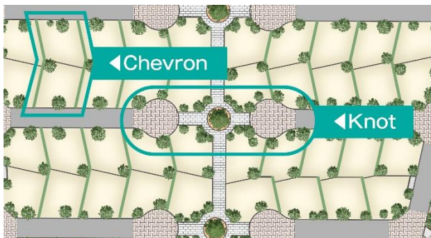
区画・建物のシェブロン(雁行区割)設計。 車を通らない遊歩道のノット(結び目)に広場を配したデザイン